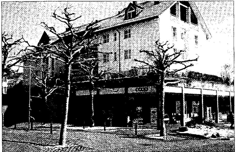
Durch einen Landabtausch mit der Gemeinde konnte Coop das Grundstück im Vordergrund erwerben. Anstelle der heutigen Ausfahrt der Zentrumsstrasse soll hier ein eingeschossiger Erweiterungsbau platziert werden. Die neue Ein- und Ausfahrt und 15 weitere Parkplätze kommen auf die andere Seite zu liegen.

Nicht zuletzt auch auf politischen Druck und durch intensive Verhandlungen dürfte es sich die Basler Zenträle nun doch anders überlegt haben. Aber nicht nur das: es brauchte auch eine Bereinigung der Eigentumsverhältnisse im Niederrohrdorfer Zentrum (siehe «Reussbote» vom 17. Februar 2006). Der abgeänderte Gestaltungsplan Bremgartenstrasse liegt aktuell ebenfalls bei der Gemeindeverwaltung öffentlich auf. Durch einen Landabtausch mit der Gemeinde konnte Coop das ideale Grundstück für die Erweiterungsbauteile erwerben. Es liegt dort, wo sich heute die Ausfahrt von Zentrumsstrasse und Tiefgarage befinden. Die Ein- und Ausfahrt soll künftig auf der anderen Seite angelegt werden. Entlang dieser fünf Meter breiten Erschliessungsstrasse werden auch 15 neue Parkplätze erstellt. 19 Parkplätze bie-